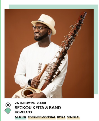
Seckou Keita & Band – Homeland Zaterdag 16 november 20u00

Twintig jaar geleden kwam Seckou Keita vanuit Senegal in Groot-Brittannië toe, met slechts een koffer en zijn kora-instrument in de hand. Ondertussen is hij uitgegroeid tot een invloedrijke en inspirerende korameester met verschillende vijfsterrenalbums en prijzen op zak. Samen met zes Senegalese muzikanten brengt hij zijn nieuwste album Homeland. Verwacht een energieke avond vol hypnotiserende ritmes.