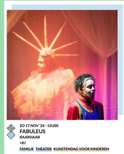
fABULEUS – Raarhaar Zondag 17 november 15u00

Twintig jaar geleden kwam Seckou Keita vanuit Senegal in Groot-Brittannië toe, met slechts een koffer en zijn kora-instrument in de hand. Ondertussen is hij uitgegroeid tot een invloedrijke en inspirerende korameester met verschillende vijfsterrenalbums en prijzen op zak. Samen met zes Senegalese muzikanten brengt hij zijn nieuwste album Homeland. Verwacht een energieke avond vol hypnotiserende ritmes.